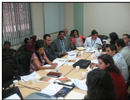
Asistentes en la reunión. DIGEPESCA