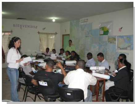
Reunión técnica, Puerto Lempira.

-Se aprobó modificar la propuesta originalmente para el Censo socioeconómico de los buzos lisiados en Gracias a Dios y que se incluyera el componente de los buzos activos, de esta manera el censo será más integral y dará aportes de información valiosos para ambos sectores de los buzos. Una encuesta modificada es necesaria. Esta modificación incluye el aumento y revisión al presupuesto. Una logística modificada fue establecida.