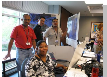
Representantes de Honduras.